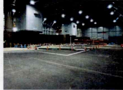
見学箇所イメージ写真