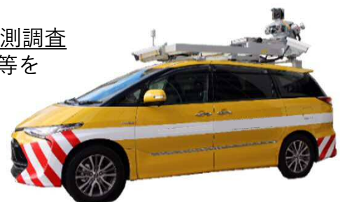
3D点群データ調査専用車両