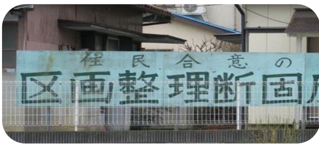
上と下の写真は事業地内で撮影。